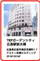
TKP ガーデンシティ 広島駅前大橋 広島県広島市南区京橋町1-7 アスティ京橋ビルディング 3F/4F/5F/6F