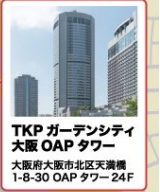
TKP ガーデンシティ 大阪 OAP タワー 大阪府大阪市北区天満橋 1-8-30 OAP タワー 24F